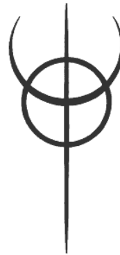
Obrázek 2: Clavicula Nox

Od excentričnosti satanismu se LHP stáhla více do sebe a společenské normy porušuje hlavně psychologicky, nikoliv veřejnými demonstracemi opozice vůči většinové společnosti. 45 Výjimku tvoří členové Order of the Nine Angles, kteří jsou nabádáni, aby páchali akty násilí za účelem rozrušení společnosti. Pozdější směry LHP také přehodnotily LaVeyův ateistický materialismus, který je vnímán jako povrchní, a začaly inklinovat k více esoterickým, spirituálním myšlenkám, které se ovšem přidržují sekulárního diskurzu. 46 LHP vyzdvihuje akademický přístup k magické práci, kterou spousta vyznavačů vnímá jako