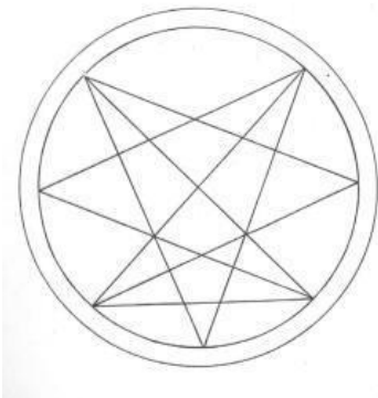
Obrázek 1: hvězda Order of the Nine Angles

zaměřil na staroegyptské božstvo Set, Rune Gild 42 na Ódina, zatímco řád Dragon Rouge nechává tuto volbu zcela na jednotlivém mágovi. Po dřívějších velkých symbolech antinomismu, jako byl obrácený pentagram, který se nyní objevoval i na graffiti a na heavymetalových nahrávkách, přišly méně známé symboly s více esoterickým významem, jako například devíticípá hvězda satanistického 43 řádu Order of the Nine Angels, symbolizující devět prvků kosmu, nebo tzv. Clavicula Nox (čes. „Klíč noci“), jež používá Dragon Rouge. Specifická je nejednoznačnost těchto symbolů, které v prostředí LHP nabývají více významů. 44