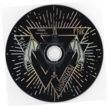
Obrázek 9: převrácený valknut na CD Ormblot od Ormgård