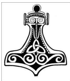
Obrázek 3: Thórovo kladivo

uměle vynalezené, oproti tomu Ásatrú vyznavači vnímají jako přirozené náboženství, které nemusí být podepřeno žádnou dogmatickou knihou, jako je Bible a Korán. 70 Dalšími velmi důležitými prvky je kult předků a dodržování jejich tradic, vyznavači se většinou staví proti multikulturalismu a globalizaci, které v jejich očích znamenají ztrátu oněch domorodých tradic a dědictví předků. Tyto postoje se mohou vystupňovat v ideje nacionalismu a rasismu, které se projevují např. v organizaci Asatru Alliance. Mezi hlavní symboly Ásatrú patří Thórovo kladivo či valknut, který je tvořen třemi propletenými trojúhelníky. Valknut má více interpretací, bývá například chápán jako symbol devíti světů severské mytologie. Rozšířeným symbolem je také sloup Irminsul, představující strom Yggdrasil, který prostupuje celým germánským kosmem.