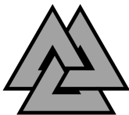
Obrázek 4: valknut