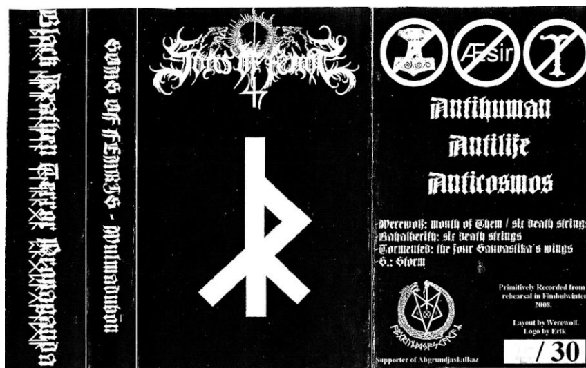
Obrázek 8: obal kazety Wulmadūbon od Sons of Fenris se symboly Thórova kladiva, Irminsulu a slova Æsir (Ásové) v zákazové značce