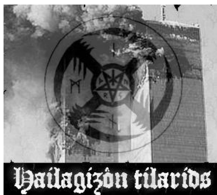
Obrázek 6: fotomontáž útoku na WTC se symbolem sauvastiky a pentagramem zobrazena na webu Scythe of Death Productions

prázdnota a utrpení v našich duších! 110 Podobná vyjádření lze nalézt i v textech irského projektu Myrkr : „ Jörmungande! Zpevni své sevření! Uvaž smyčku, abys udusil všechnu naději v lidstvo! “ 111