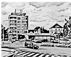
Malvazinky ve stínu 20. století