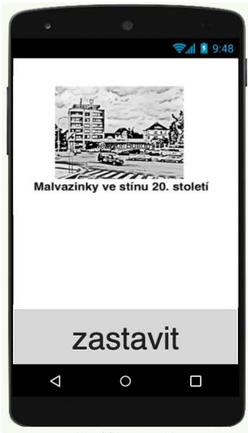
Obrázek 1: Vzhled aplikace