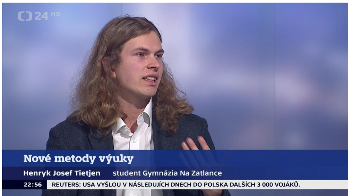
Obrázek 4: Rozhovor 11. 2. 2022 v Událostech, komentářích na ČT24