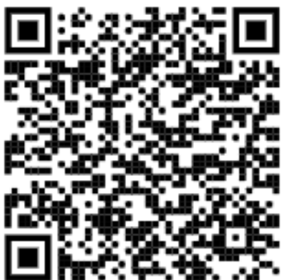
Obrázek 2: QR kód aplikace na Google Play