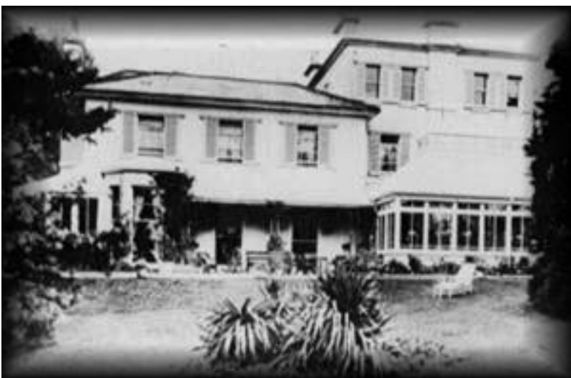
Agathin rodný dům Ashfield.