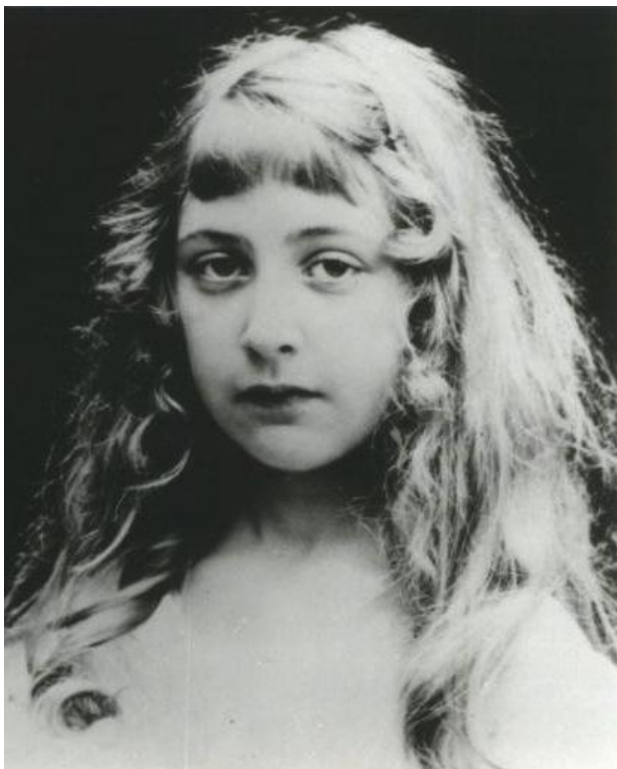
Agatha Christie jako dítě.