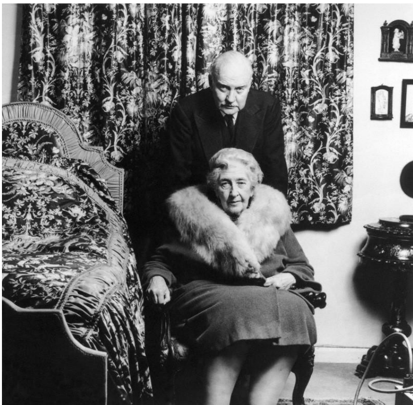
Agatha Christie se svým manželem, archeologem Maxem Mallowanem.