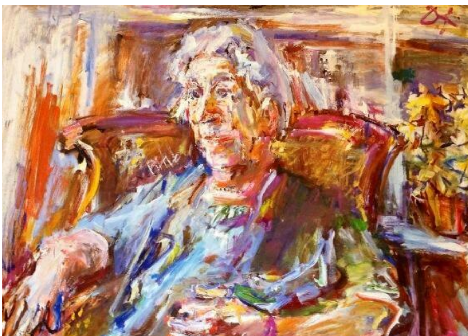
Královna zločinu zvěčněná na obraze slavného malíře Oskara Kokoschky.