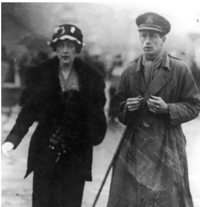
Agatha Christie se svým prvním manželem, plukovníkem Archibaldem Christiem.