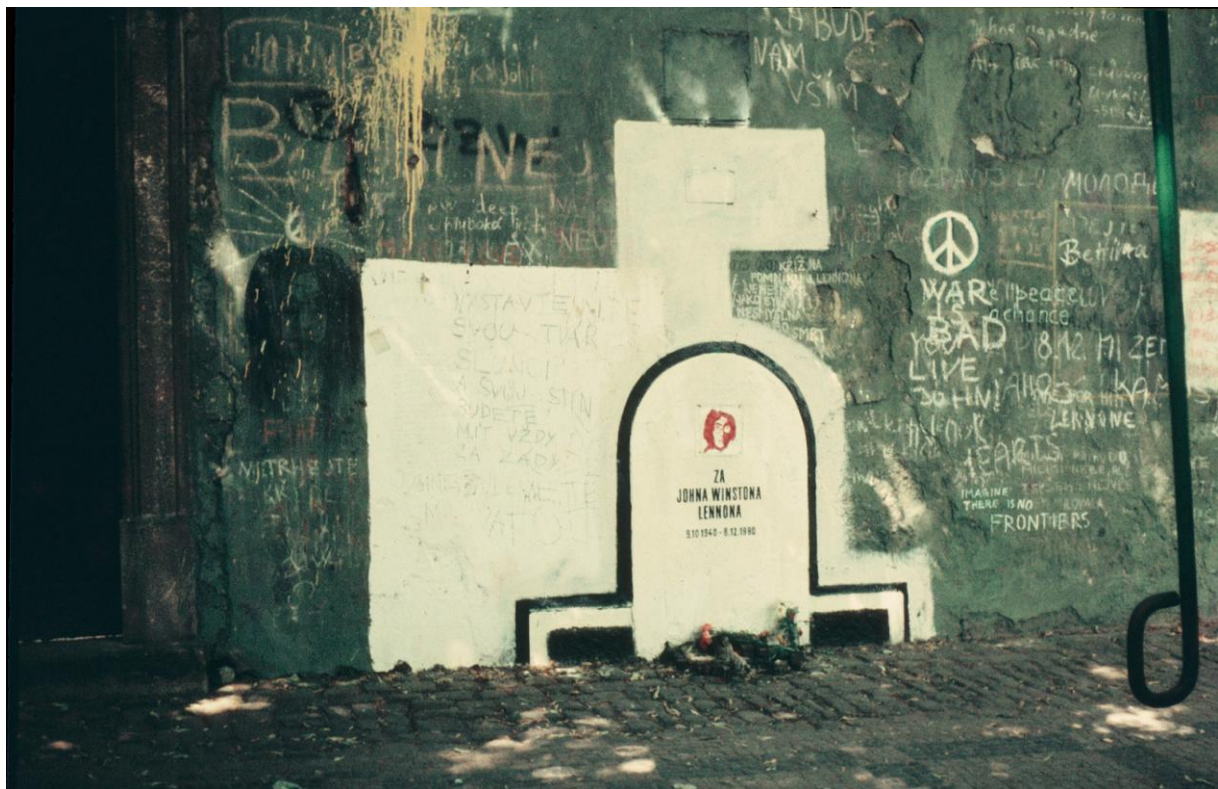
Příloha č. 20: Fotografie Lennonovy zdi s provizorním pomníkem v Praze z roku 1983