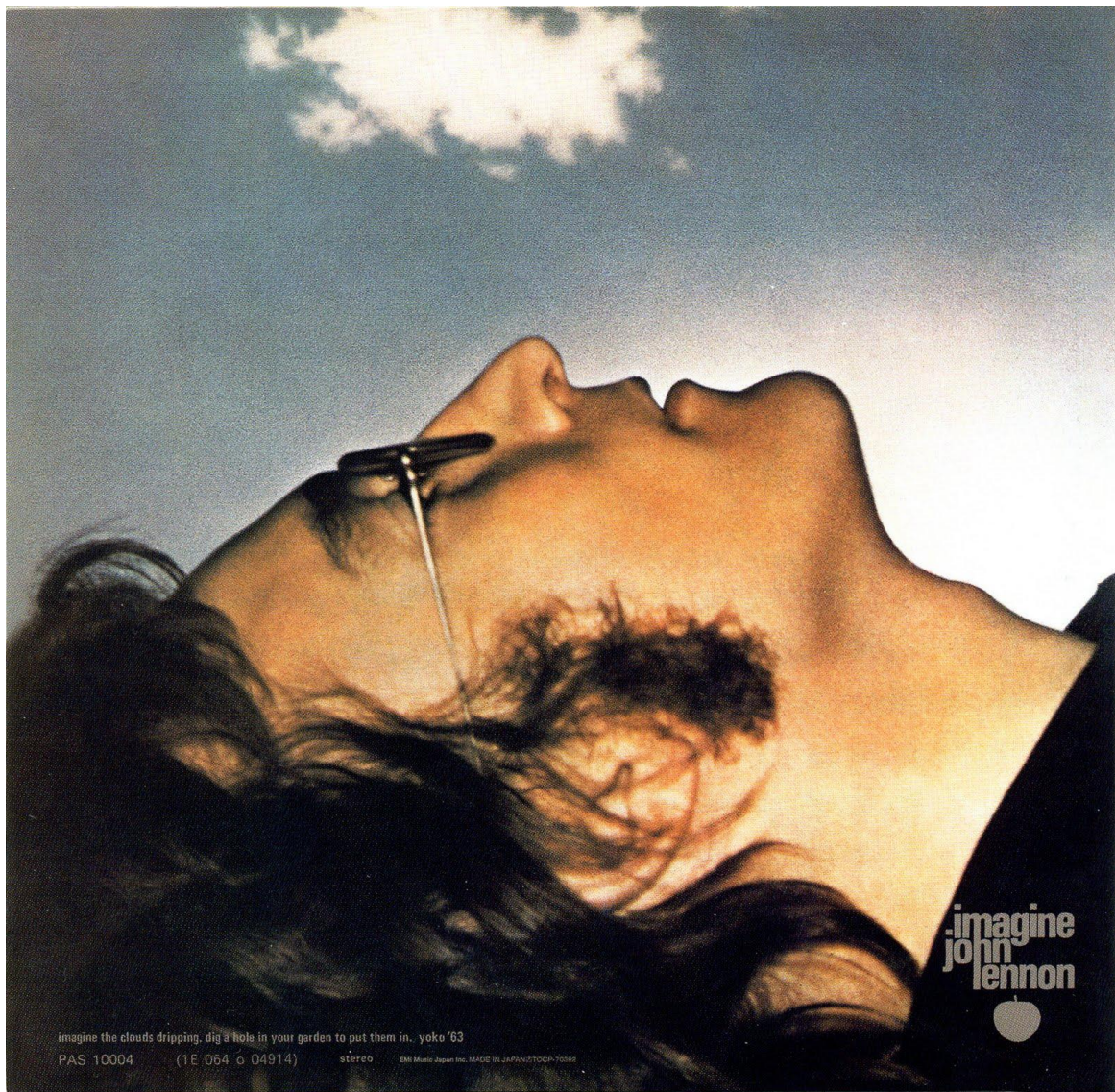
Příloha č. 10: Zadní strana obalu alba Imagine (1971)