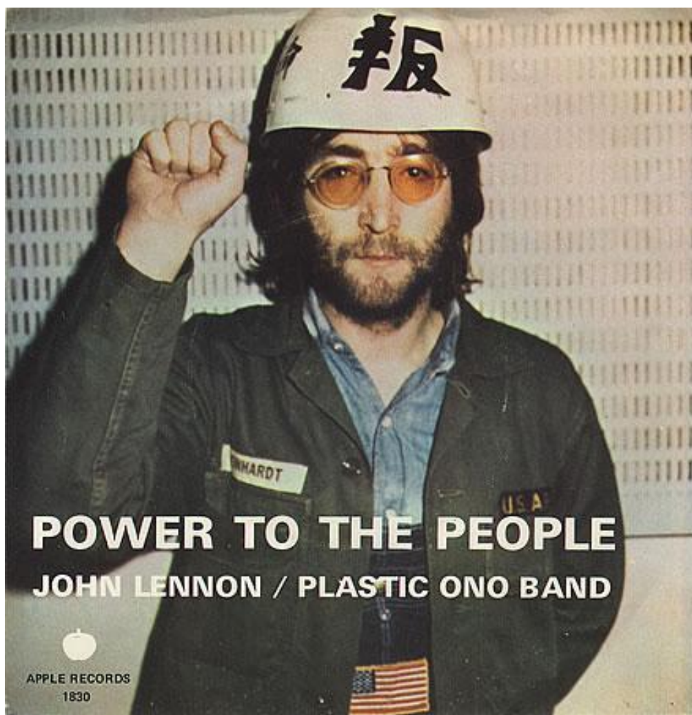
Příloha č. 9: Přední strana obalu singlu Power To The People (1971)