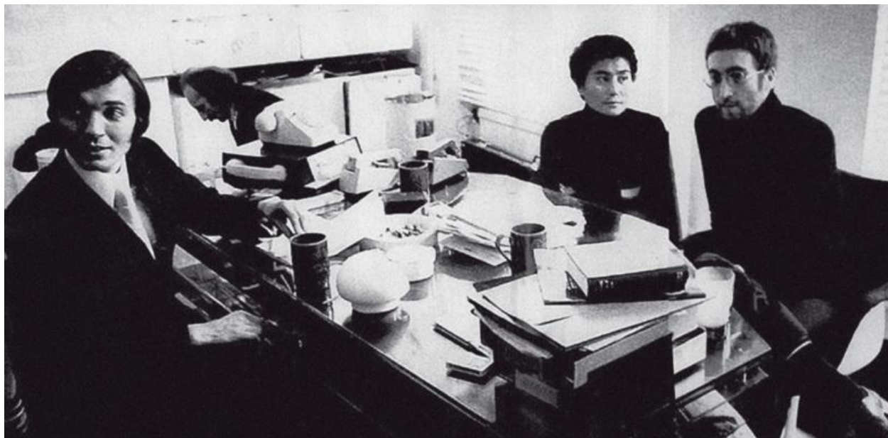
Příloha č. 19: Fotografie ze setkání Karla Gotta s Johnem Lennonem a Yoko Ono v budově nahrávací společnosti Apple v Londýně z roku 1971