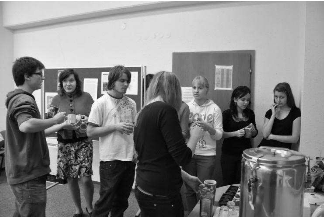
(Obr. 8: KAFE)