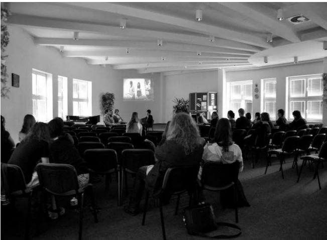
(Obr. 9: KAFE2)