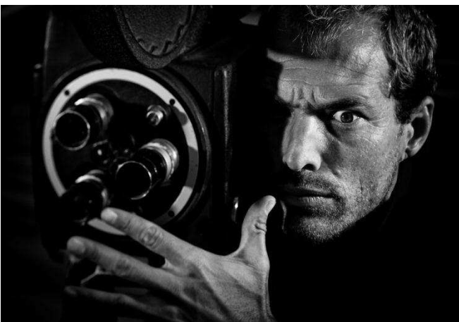
(Obr. 10: Propagace GAWAfilmu)