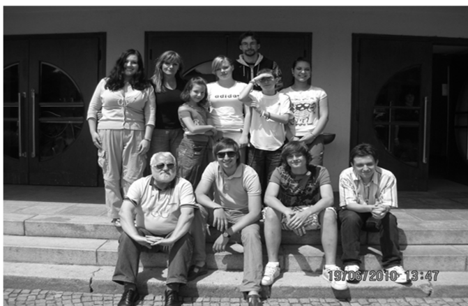
Obr. 3: Tvůrčí skupina v Ústí nad Orlicí