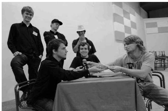
Obr. 6: Členové GAWAfilmu