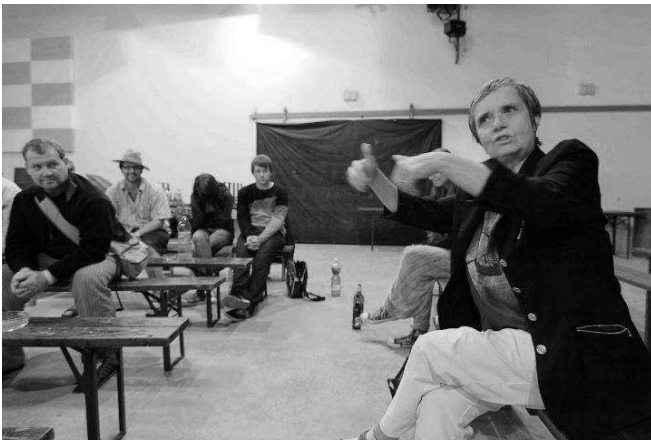
(Obr. 7: Filmová noc v lázních)