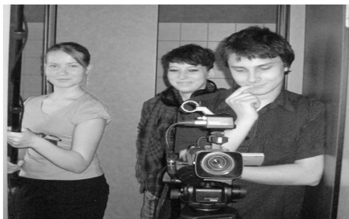
Obr. 4: Práce na filmu (Tannenlohe)