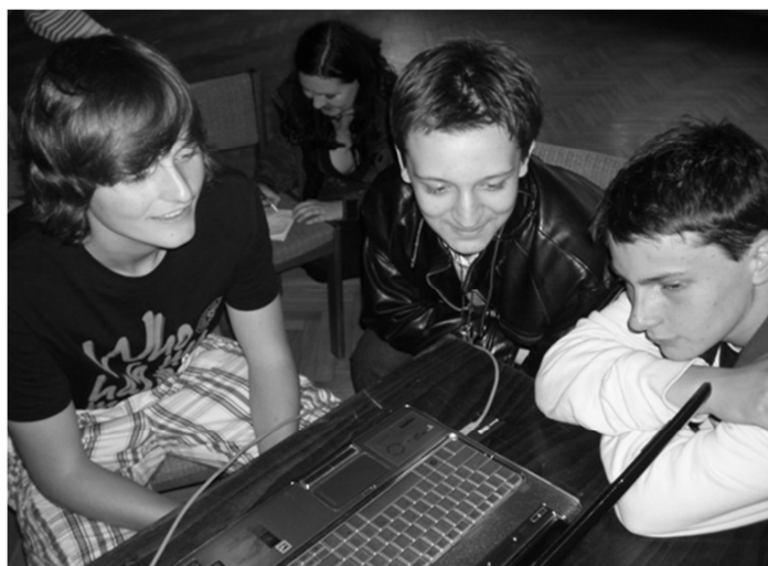
Obr. 2: Postprodukce filmu na workshopu