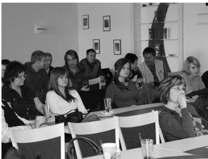
Obr. 1: Studenti během diskuse