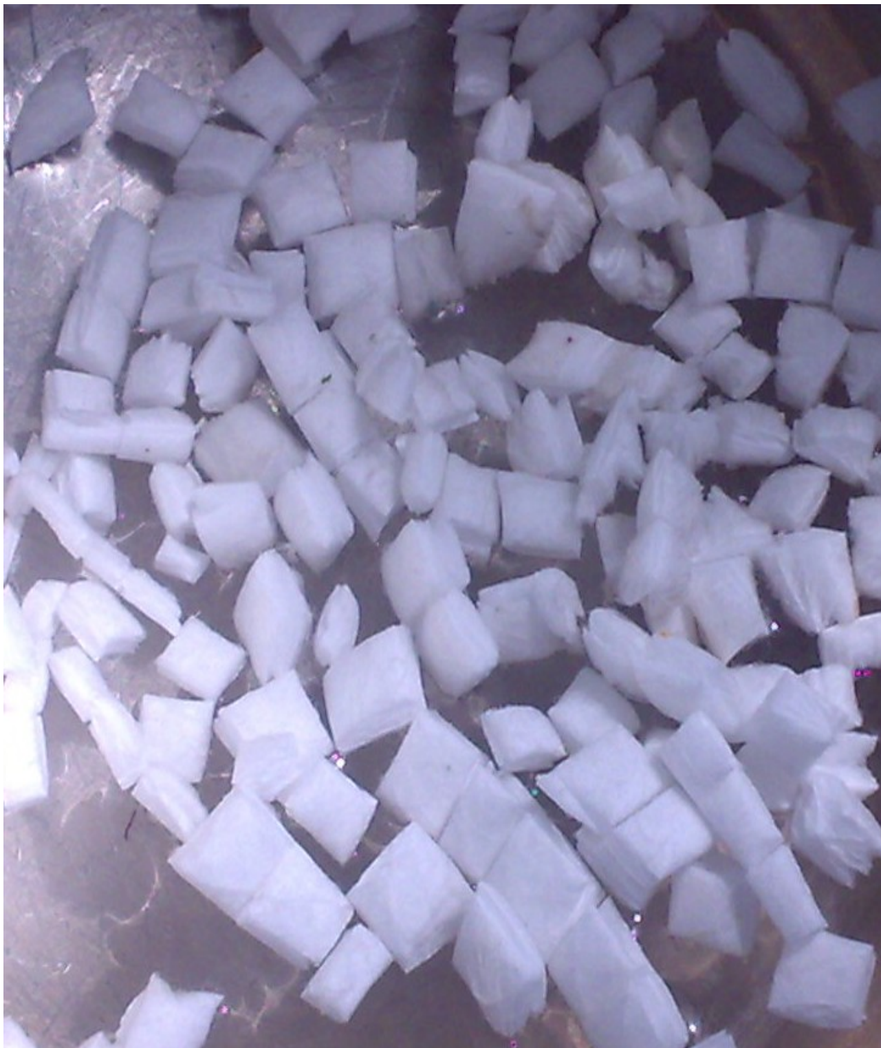
Ilustrace 1: Příprava sorbční rohože, nastříhání a praní v destilované vodě