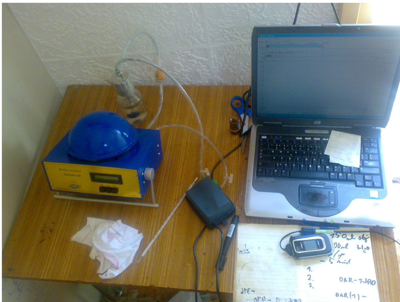
Ilustrace 5: Měření Radimem (zařízení ověřeno ČMI) a zjišťování hodnot pomocí přenosného počítače