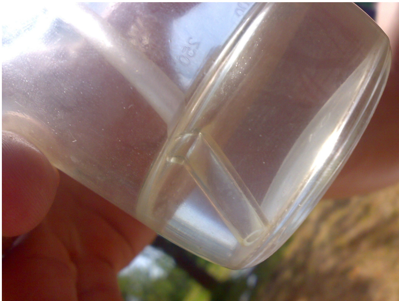
Ilustrace 3: Převod do vzorkovnice Radimu pomocí silikonových hadiček pro snížení kontaktu vody se vzduchem