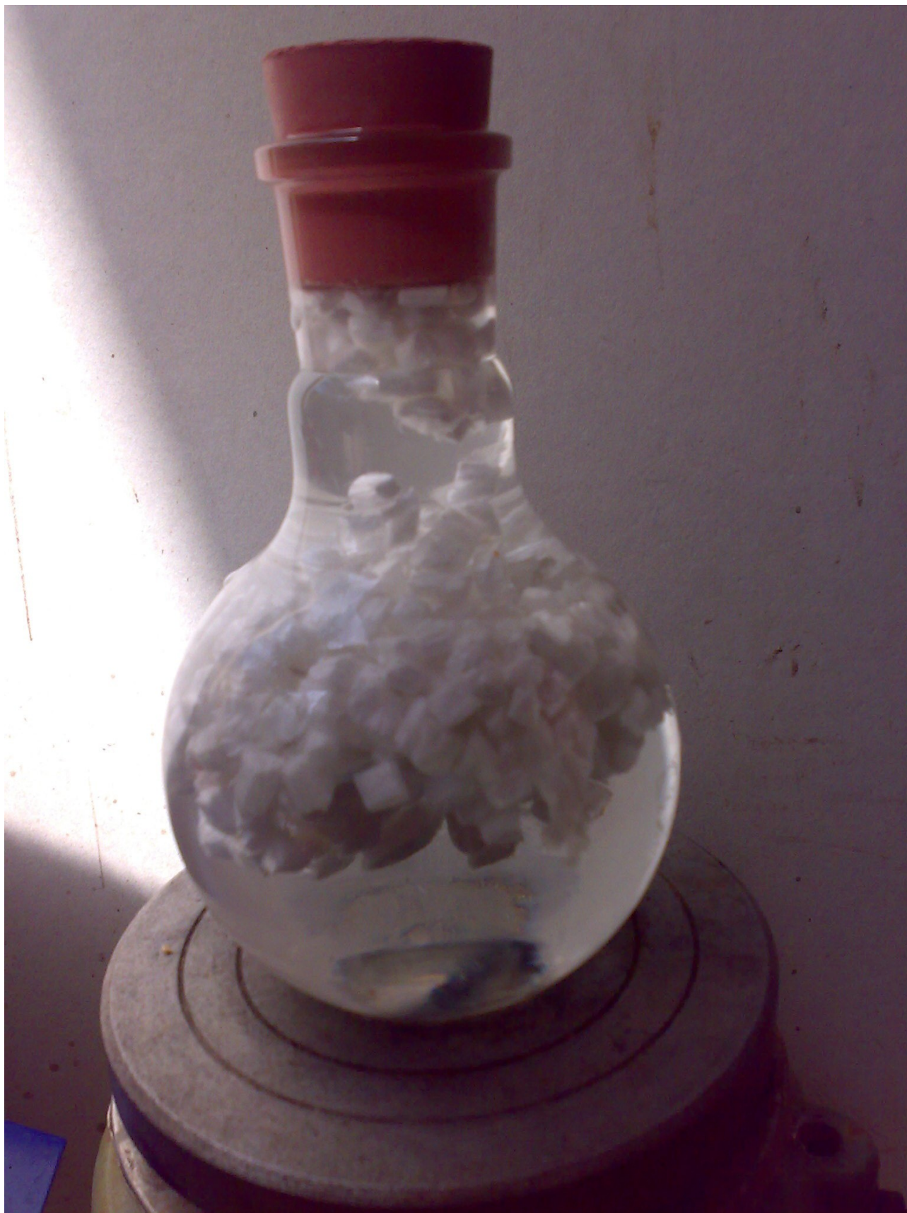
Ilustrace 2: Míchání 10 g hydrofobní sorbční rohože HR2200